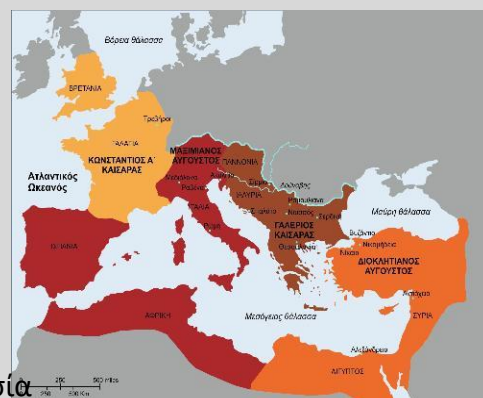
Η Ρωμαϊκή αυτοκρατορία κατά την πρώτη Τετραρχία. 293

από τους μαθητές: Φωτίου Απόστολο, Παπαδόπουλο Θόδωρο, Ράμο Μικέα