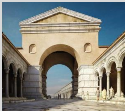
Ψηφιακή αναπαράσταση της αψίδας του Γαλέριου.

Η θριαμβική αψίδα βρίσκεται πλάι στη σημερινή Εγνατία οδό της Θεσσαλονίκης. Το μνημείο χτίστηκε από τον Καίσαρα Γαλέριο στις αρχές του 4ου αι. και ήταν μέρος των γαλεριανών ανακτόρων. Η αψίδα κατασκευάστηκε, για να τιμηθεί ο Καίσαρας Γαλέριος,